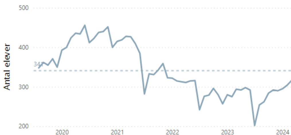
Antal elever over tid

I nedenstående graf er den samlede elevtalsudvikling for FGU Aalborg over tid